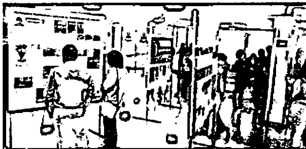
Exposição pelos 43 anos do PT foi aberta ontem (14), na Assembleia Legislativa

realidade de direitos adquiridos. Pra mim, é uma história que parte eu já conheço e outra, às vezes, a gente esquece, mas é bom quando lembramos".