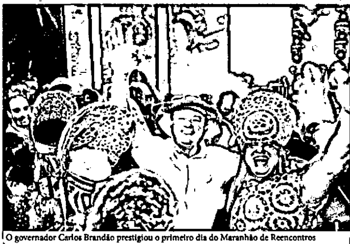
O governador Carlos Brandão prestigiou o primeiro dia do Maranhão de Reencontros

Os grupos do Bumba Meu Boi Meu Tamatiñeiro, subiram ao palco no primeiro dia do Maranhão de Reencontros, nos consagrados da cultura popular maranhense, como o cantor Mano Borges, acurá de Dona Tetê, Cia Barrica e o grupo de Santa Fé (sotaque da Baixada) errando a programação. Maranhão de Reencontros já se tornou parte do calendário do Governo do Estado.